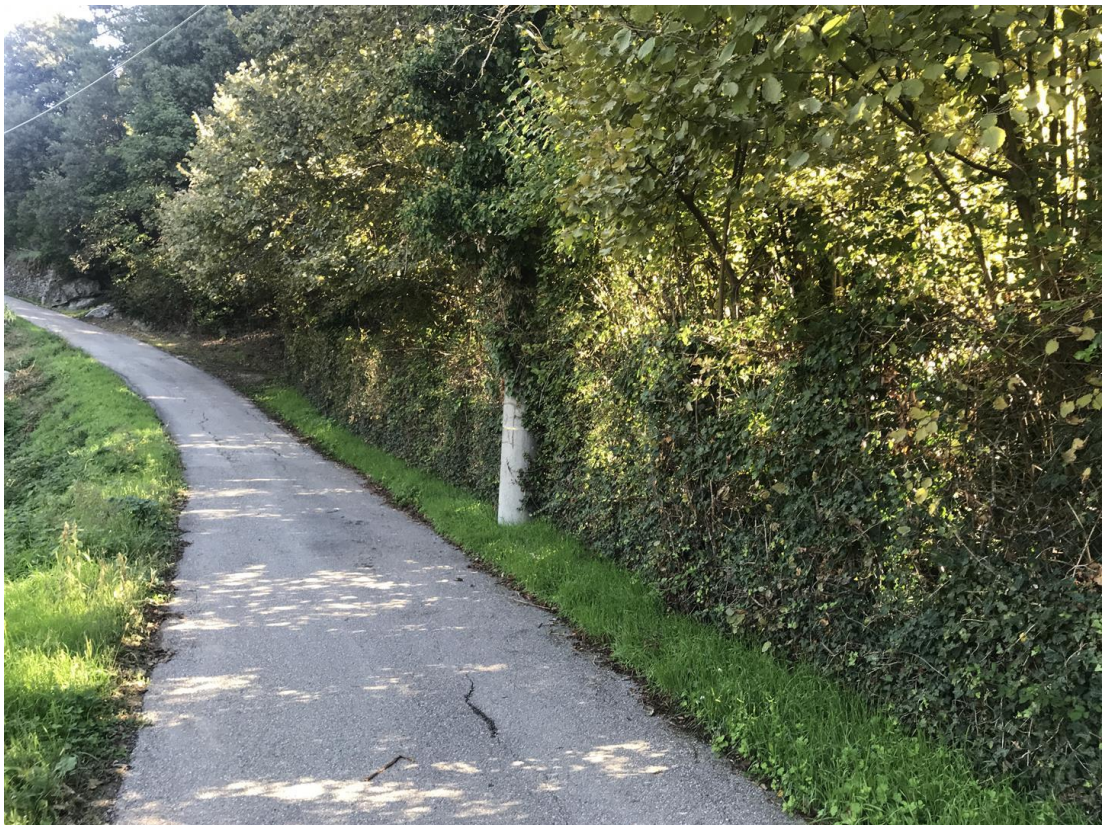
Foto n. 4 - Sviluppo del tratto stradale con il dettaglio del palo ENEL