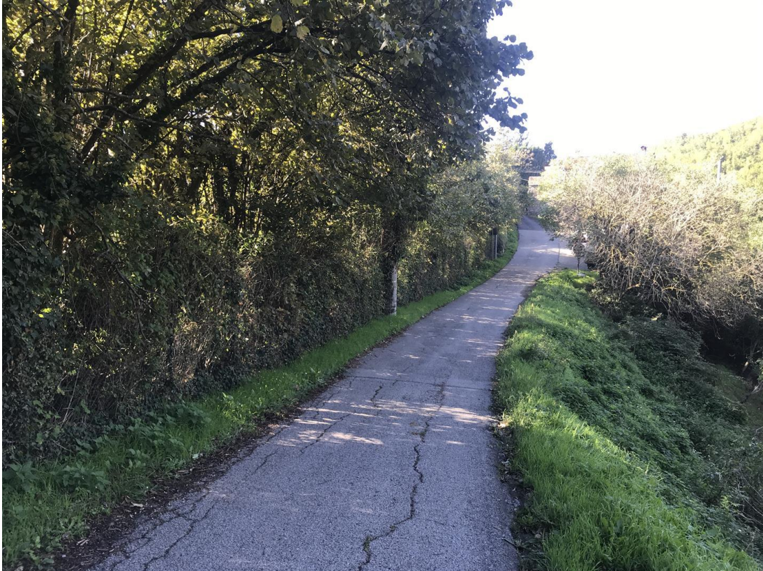
Foto n. 7 - Vista della sottoscarpa stradale con abbassamento del terreno