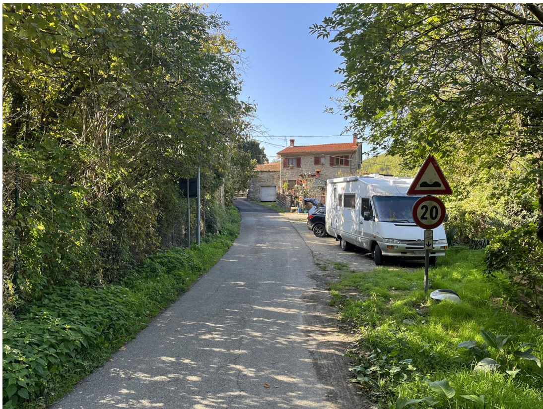
Foto n. 8 - Vista del tratto stradale in direzione la Piazza