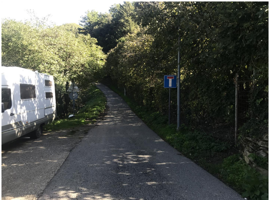
Foto n. 2 - Panoramica del tratto stradale nel settore di larghezza maggiore