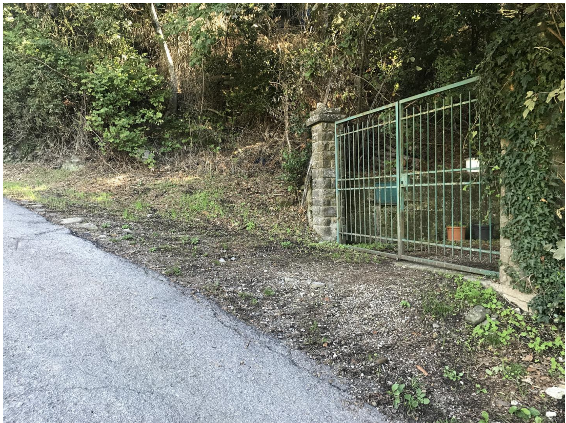
Foto n. 6 - Dettaglio del cancello