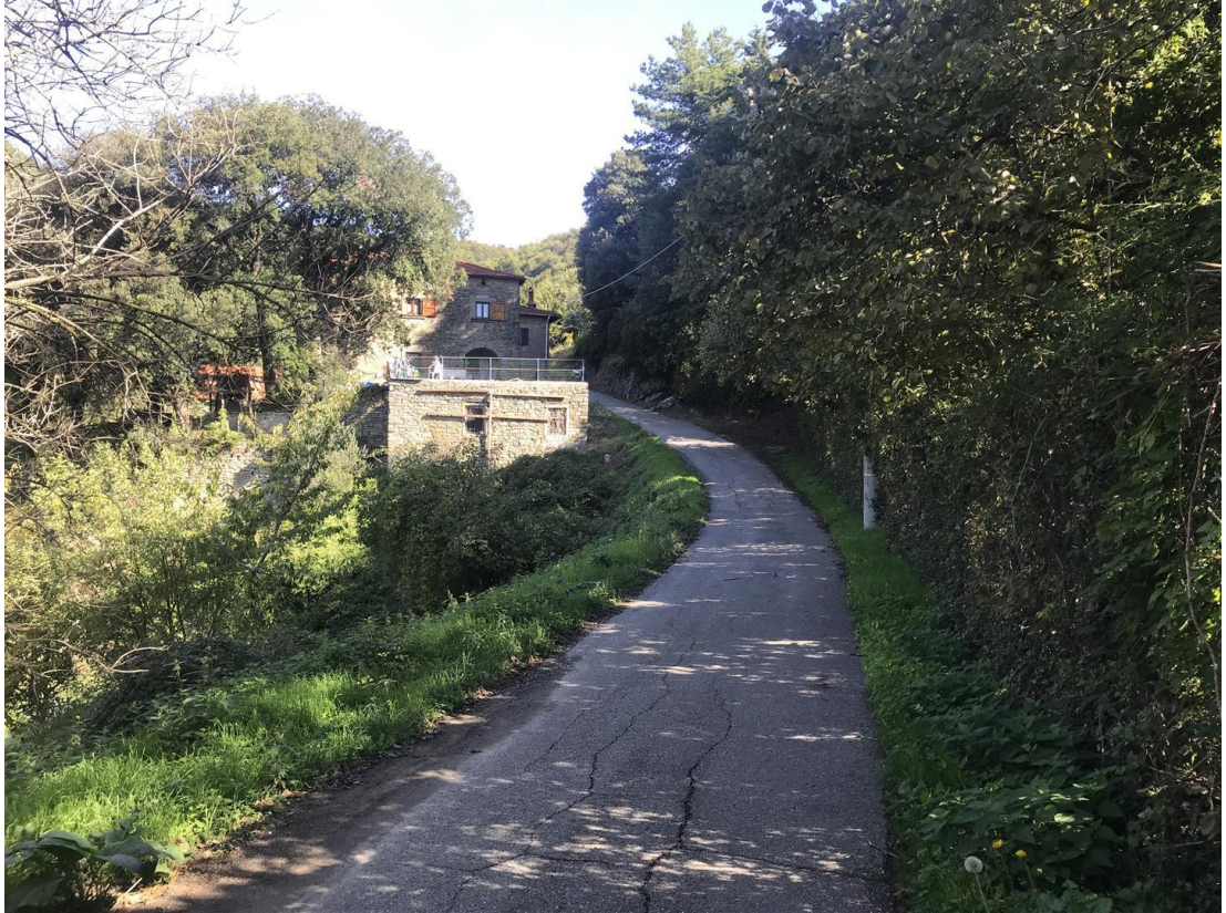
Foto n. 3 - Panoramica del tratto stradale con vista della sottoscarpa