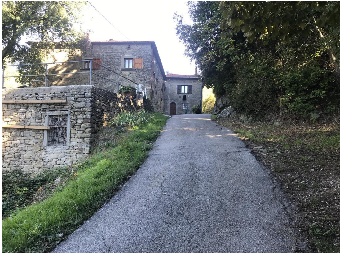
Foto n. 5 - Vista del tratto stradale in direzione il Prato