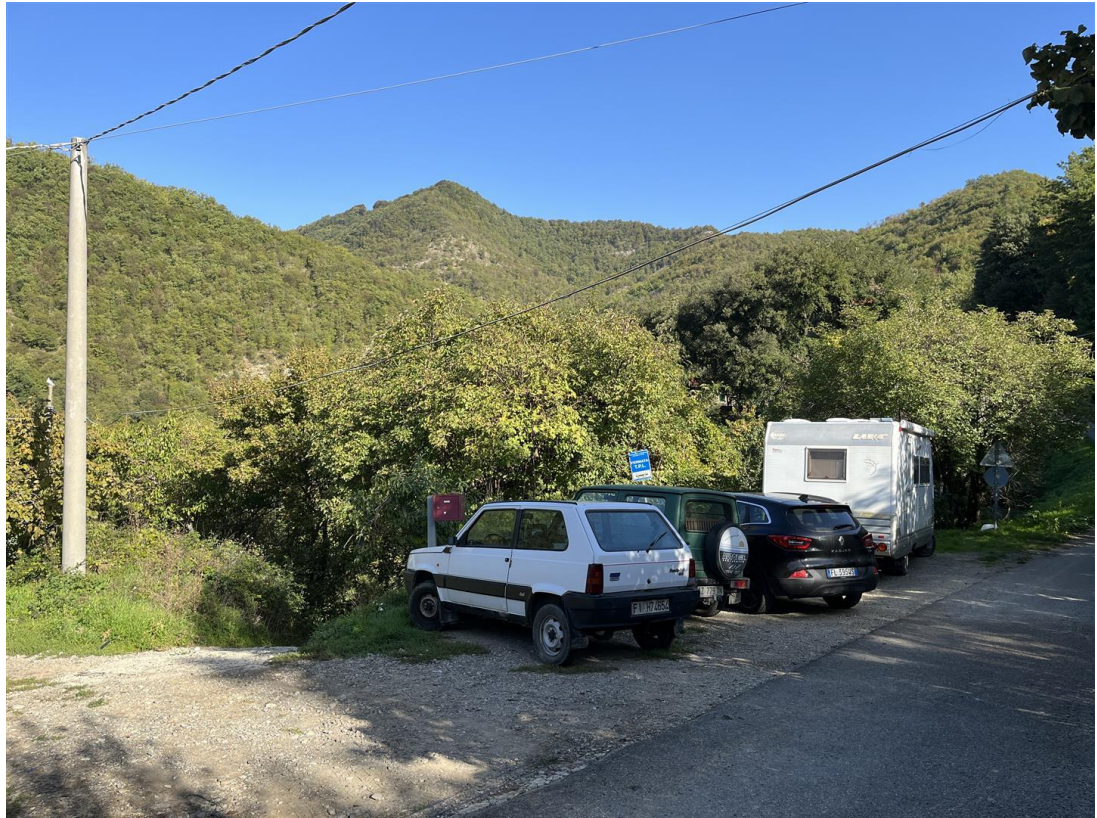
Foto n. 1 - Vista della strada sterrata