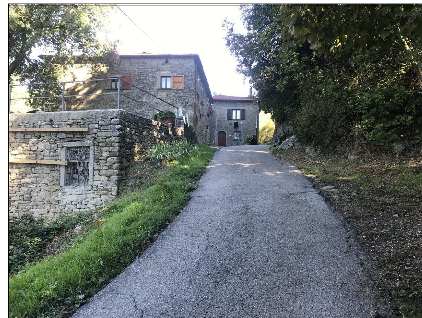
Foto n. 5 - Vista del tratto stradale in direzione il Prato