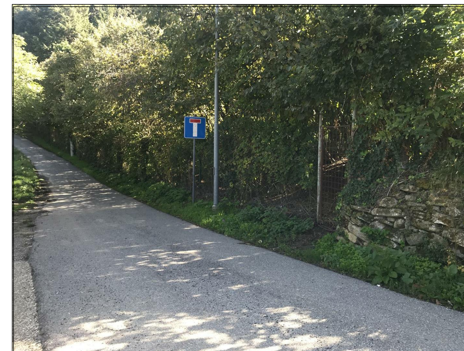
Foto n. 9 - Dettaglio del muretto in pietra con il palo di illuminazione stradale