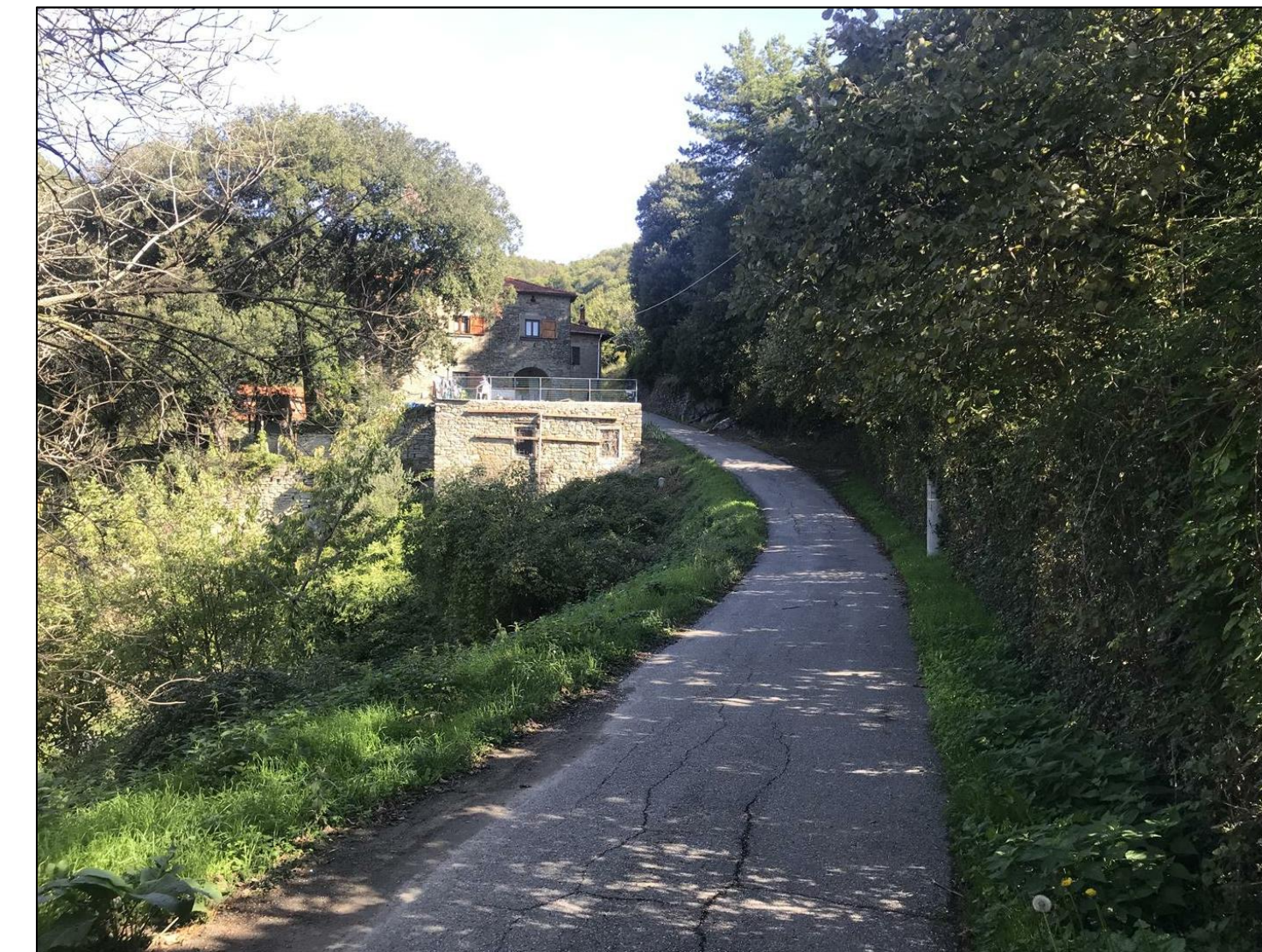
Foto n. 3 - Panoramica del tratto stradale con vista della sottoscarpa