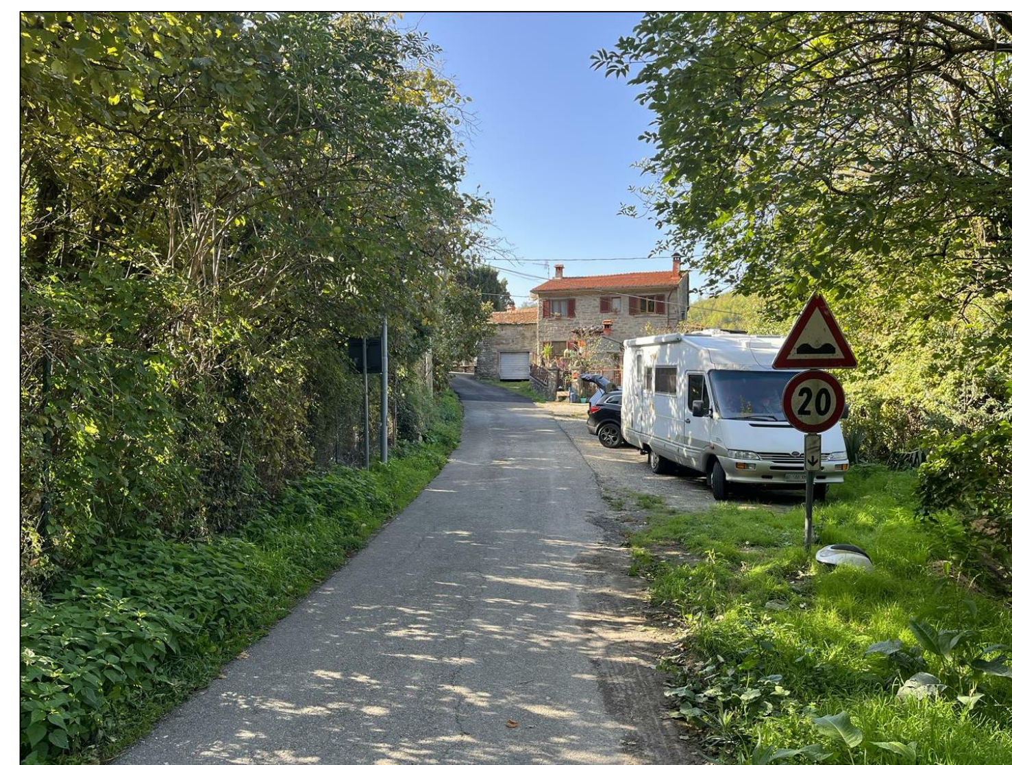
Foto n. 8 - Vista del tratto stradale in direzione la Piazza