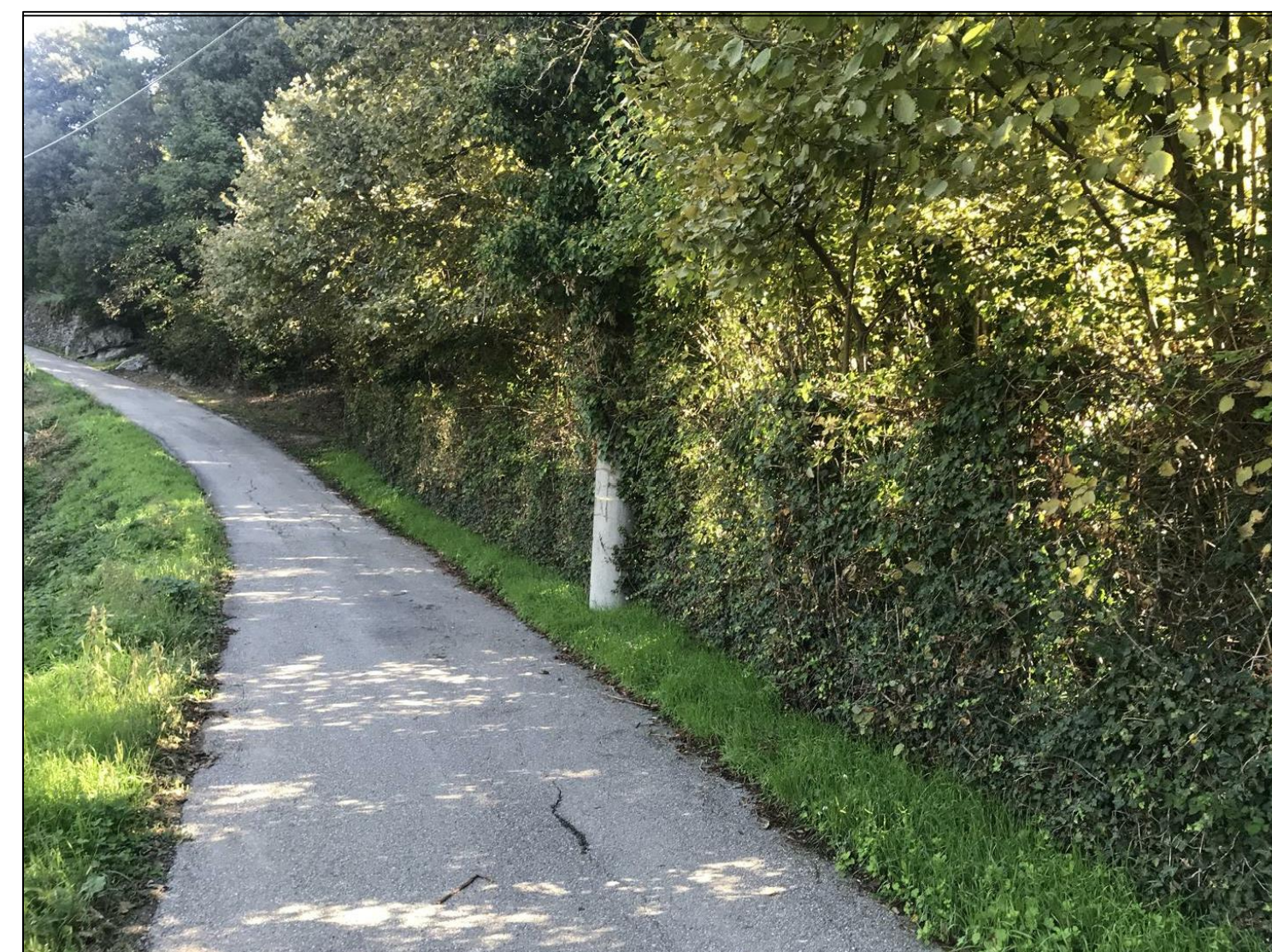
Foto n. 4 - Sviluppo del tratto stradale con il dettaglio del palo ENEL