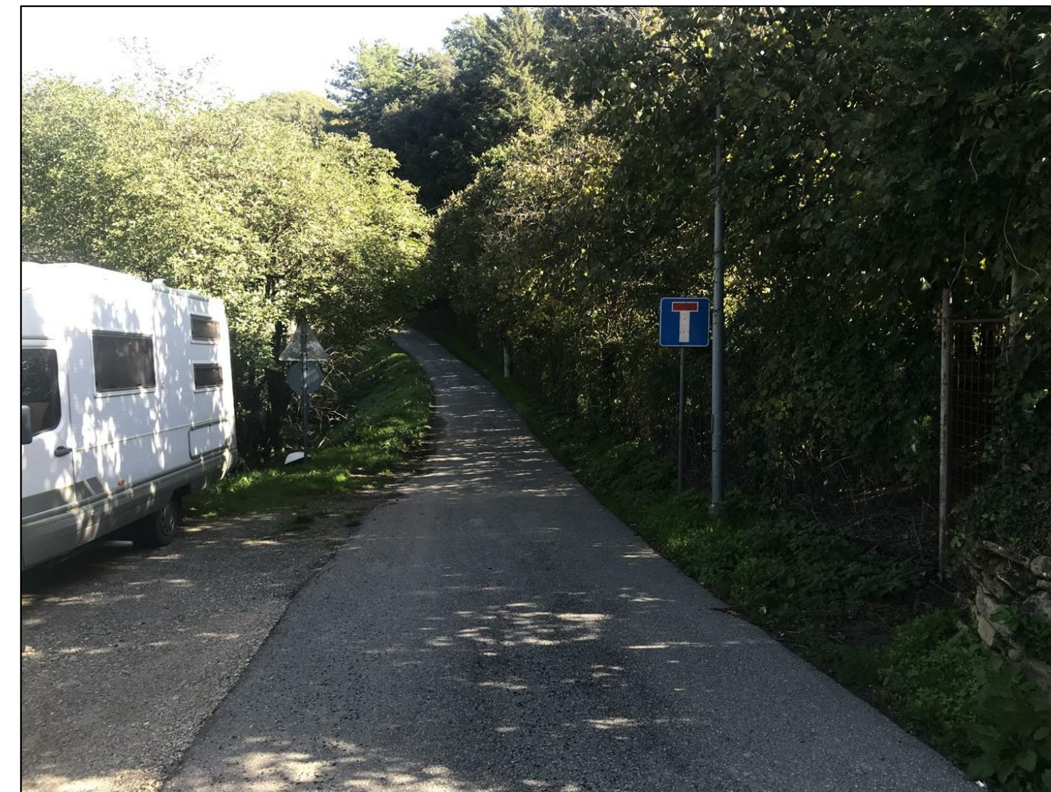
Foto n. 2 - Panoramica del tratto stradale nel settore di larghezza maggiore