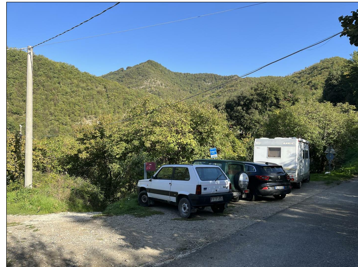
Foto n. 1 - Vista della strada sterrata