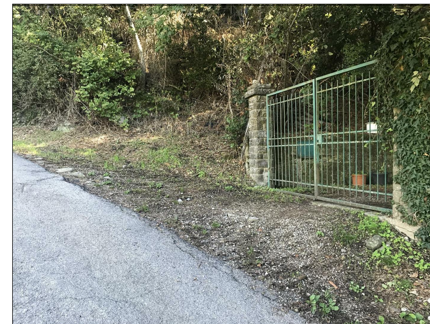
Foto n. 6 - Dettaglio del cancello