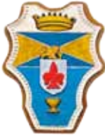
Comune di Dicomano