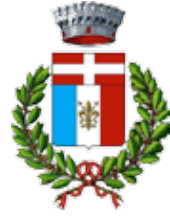
Comune di San Godenzo